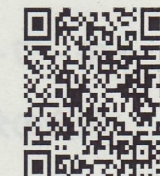
税務署への電話はこちらから

書類や事実関係を確認する必要がある場合など、チャットボットやタックスアンサー、電話相談センターによる解決が困難な相談については、面接にて相談を受け付けています。